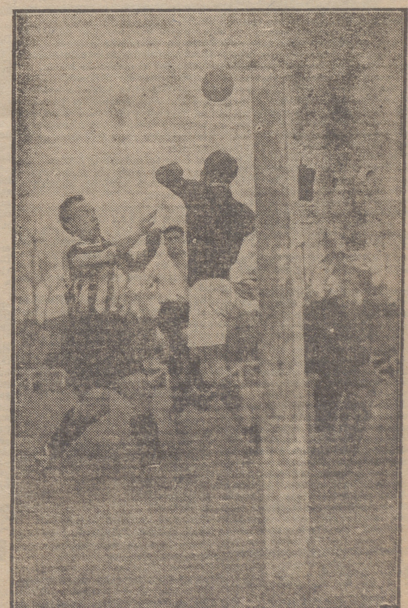
EL PORTERO DEL UNION DE VIGO DESPEJA UNA APURADA SITUACION, ACOSADO POR JULIAO.