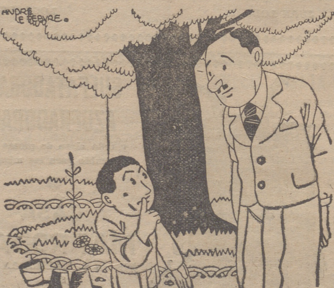
¿Quieres sacar ese dedo de la nariz, marranillo? ¿Tu sabes lo que es un marranillo? —Sí; el hijo de un marrano. (De "Le Journal Amusant".)

PARA LAS VISAS CALDO PAX Sulfatar con este producto, es asegurar las cosechas. SUPERVIELLE.—RENTERIA.