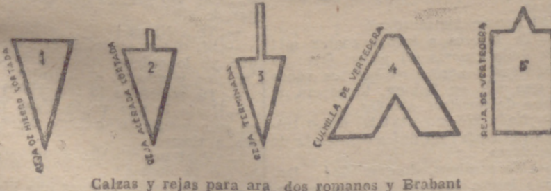
Calzas y rejas para ara dos romanos y Brabant

SE COMPRAN BANDAJES DE CAMION, AROS DE CARRO Y DE CUBAS Y TODA CLASE DE MATERIALES DE HIERRO Y METALES USADOS.—ESTA ES LA CASA QUE MAYORES PRECIOS PAGA.