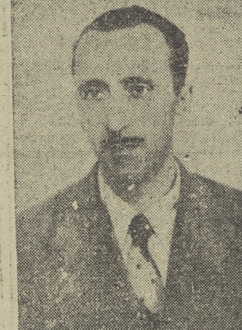
(De nuestro corresponsal, FRANCISCO ROJAS.)