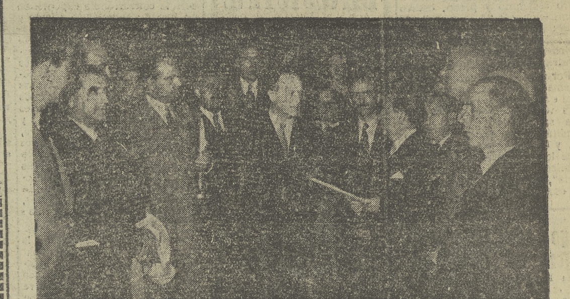
El Ministro Secretario General del Movimiento recibe a la Comisión del Sindicato Nacional del Combustible, presidida por el Delegado Nacional de Sindicatos, que le entregaron las conclusiones de la Asamblea de la CAMPSA.