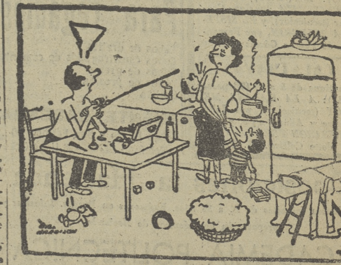
—No me extraña que te aburras: lo que necesitas es ocuparte.

Méjico, 8.—Victor Raúl Haya de la Torre ha llegado a Méjico, después de haber estado refugiado cinco años en la Embajada colombiana de Lima.—Efe.