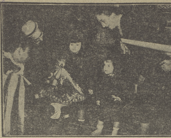
Ha terminado el Concurso Nacional de Tunas Universitarias del S.E.U. Antes de abandonar Madrid, la de Oviedo visitó en el Palacio de El Pardo a la esposa y nietas de S. E. el Jefe del Estado, ante las que dio un concierto. En la foto, los componentes de la Tuna ofrecen a las nietas del Caudillo regalos.