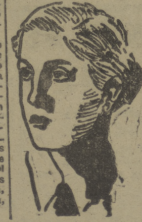
(Pasa a páginas centrales)

«Es preciso un nivel más alto de educación y cultura del pueblo español» (Pilar Primo de Rivera)