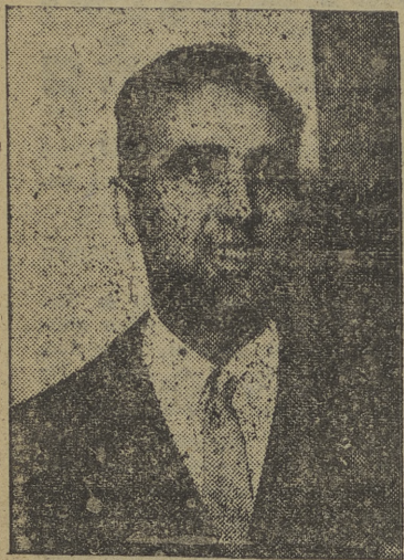
MADRID. — El ministro de Educación Nacional ha hecho las siguientes declaraciones a la revista "El Magisterio Español":

Así quedarán más acoplados a las remuneraciones de otros servidores del Estado Declara el ministro de Educación Nacional, señor Ruiz Jiménez