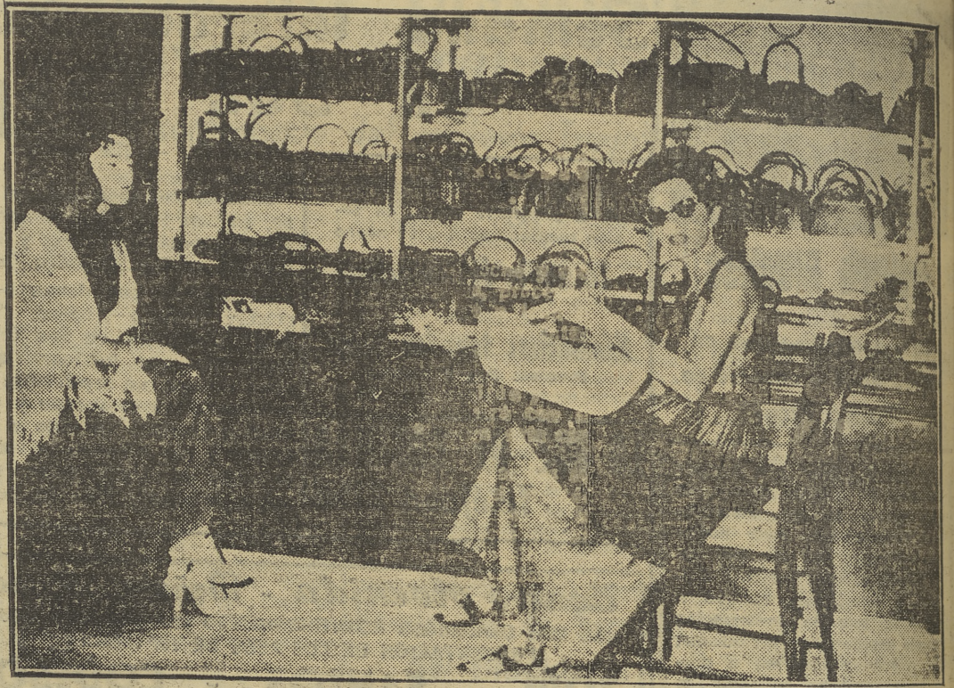
He aquí a la emperatriz persa Soraya comprando un bolso en una tienda romana, durante su estancia en espera del regreso a Teherán