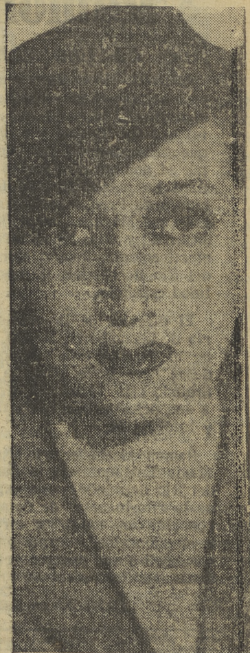
La noticia del día