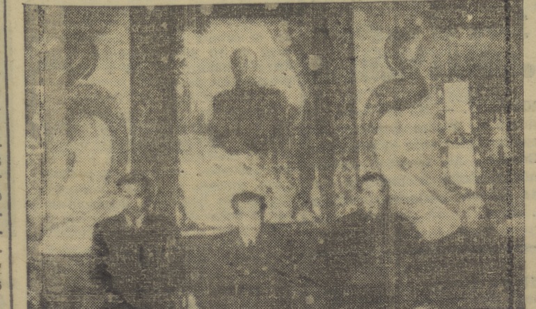
El domingo tuvo lugar la solemne inauguración de los Cursos de Verano del Instituto “Francisco Suárez”. En la foto de Villafraña, las autoridades en el acto de apertura. (Amplia información en páginas centrales)