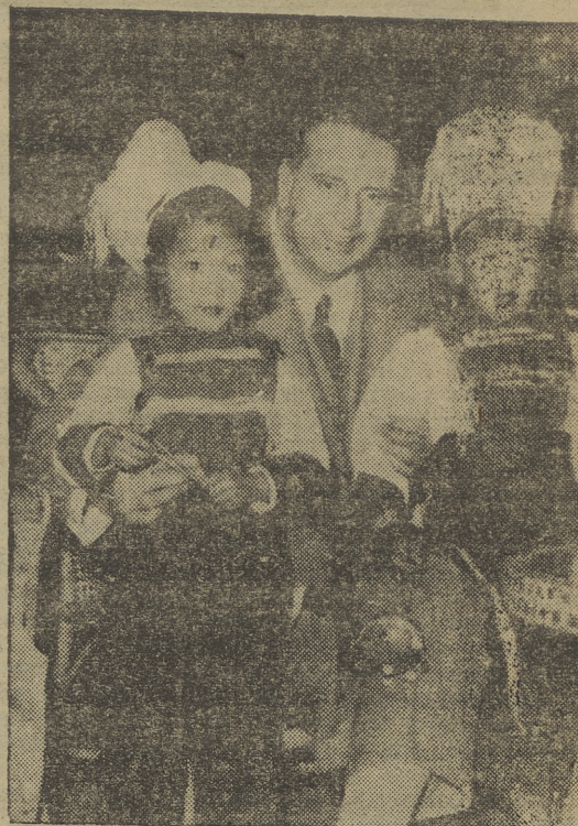
Durante su estancia en Taipé el ministro español de Asuntos Exteriores visitó la Residencia de los PP. Dominicanos. En la foto, el señor Martín Artajo posa con dos niños chinos asistentes a las escuelas católicas de la isla

WASHINGTON, 13 -- La energía atómica se empleará, en un plazo inferior a cinco años, para suministrar luz a las casas y para las máquinas de las industrias, según dice una revista semanal. (Efe).