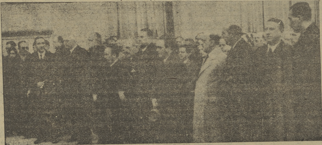
Presidencia del entierro de don Antonio Goicoechea, en la que figuraban la mayoría de los ministros.