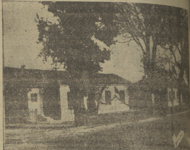
Vista de las viviendas ultrabaratadas del grupo "Juan Yagüe" en Miranda de Ebro, situado cerca de la carretera de Madrid.