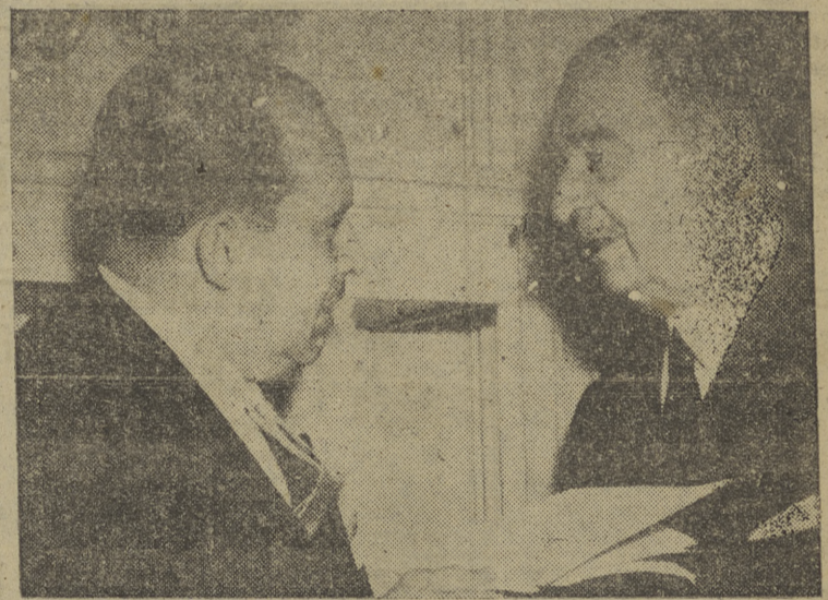
D. Guillermo Sevilla Sacasa, embajador de Nicaragua en los Estados Unidos, hace entrega al embajador español, don José Félix de Lequerica, de la proposición de países hispanoamericanos para que España solicite su ingreso en la Organización de las Naciones Unidas.

(Referencia completa de lo tratado ayer en el Consejo en páginas centrales)