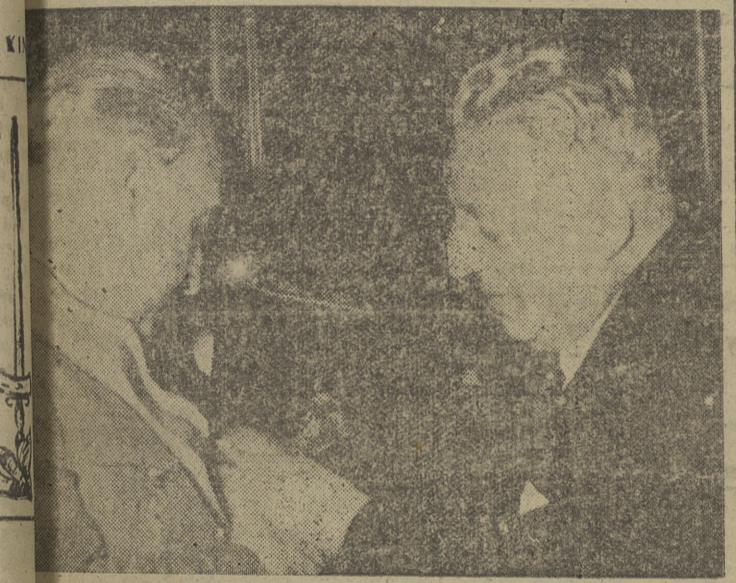
El ministro de Asuntos Exteriores de Siria, doctor Rifai, en el momento de imponer a S. E. el Jefe del Estado Español, Generalísimo Franco, el collar de los Omeyas.

El presupuesto fija en setenta y cinco millones de dólares la ayuda civil de Corea, durante el próximo ejercicio fiscal. Además, autoriza la transferencia hasta de treinta y cinco millones en materiales del Ejército para ayudar en los trabajos de reconstrucción, si es necesario. (Efe).