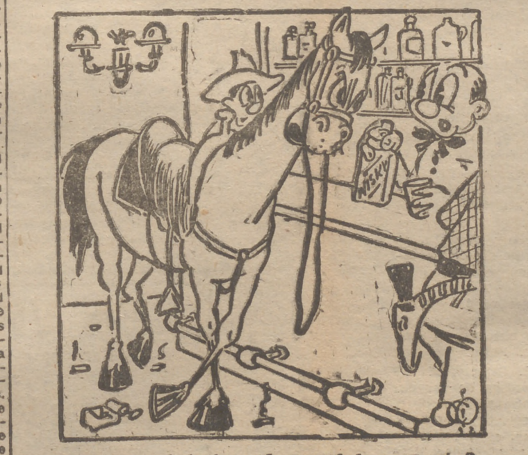
—No tiene usted algo más apropiado para mí?—