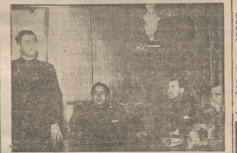
La presidencia del acto.