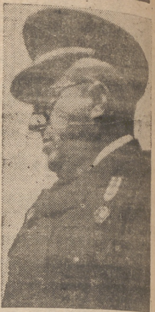
El llorado general Yagüe, artífice de esta gigantesca obra que es la Ciudad Deportiva

"Las mujeres inglesas debían ir a la Cámara de los Lores".