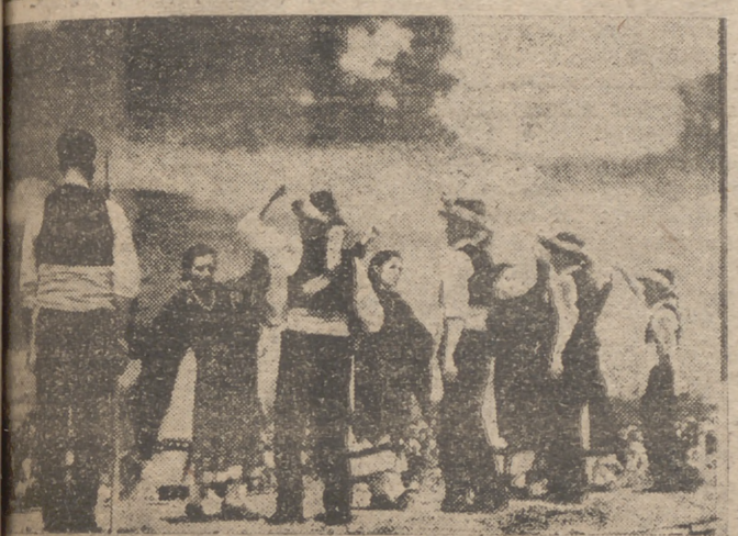
Algunos momentos de los actos celebrados en Barbadillo del Condado con motivo de la romería castellana organizada el domingo por el Orfeón Buralés, y de la que informamos en páginas interiores.