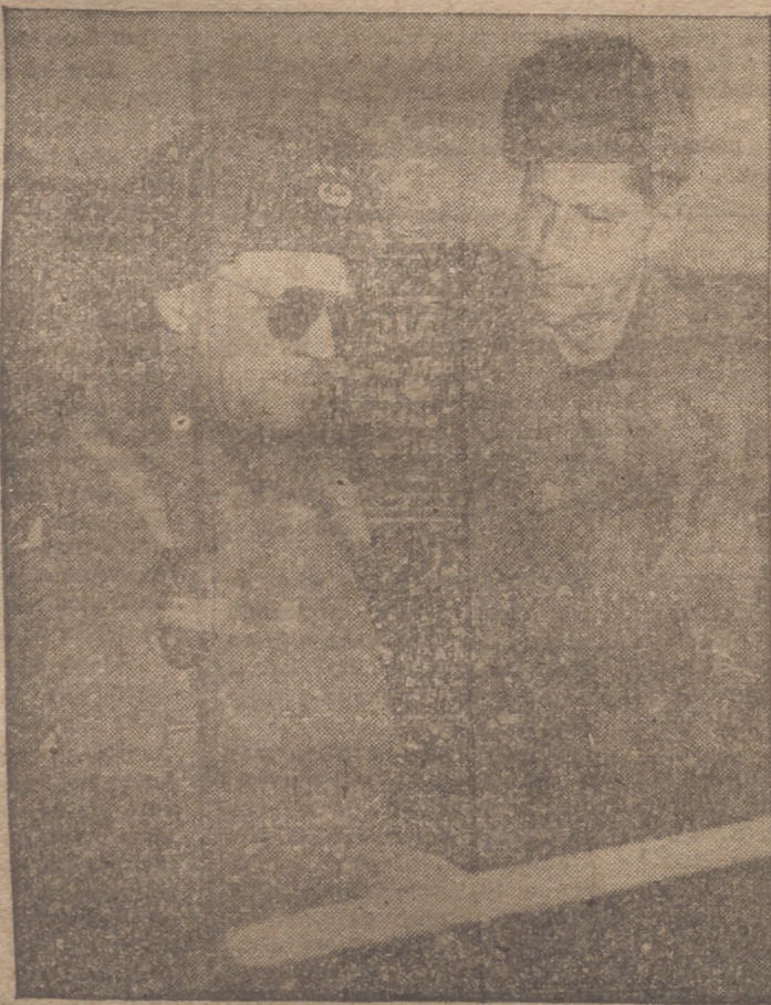
Estos son los generales norteamericanos Ridgway y Clark, jefe de las fuerzas de la NATO, el uno, y comandante de las NN. UU. en Corea el otro. Ambos se encuentran atados de pies y manos. En su verdadera función Ridgway es pri-

Almas sanas en cuerpos sanos. Educación Física de la Sección Femenina. Aire, luz, sol. Magníficos elementos para educar los músculos y la voluntad. Educación Física de la Sección Femenina.