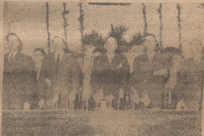
Presidencia en el acto inaugural de los Cursos de Verano para Extranjeros, del que informamos en séptima página.

BUENOS AIRES, 1. — El cadáver de doña Eva Duarte de Perón será embalsamado. Por desecho del presidente, el cadáver permanecerá en el Ministerio de Trabajo hasta el 9 de agosto y después será llevado al Congreso, donde estará expuesto durante un breve período. Después serán trasladados los restos a la sede de la Confederación General del Trabajo. Millares de personas siguen desfilando día y noche ante el féretro. Los honores de presidente muerto en el ejercicio de su cargo serán tributados al cadáver de la eximta dama cuando el féretro sea trasladado del Ministerio de Trabajo al Congreso. (Efe).