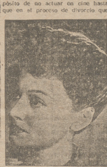
ahora tramita se decide la custodia de su hijo.

Las últimas noticias del "indio" Fernández son que vendrá acompañado de su esposa, la actriz Colomba Domínguez, a mediados de julio, para dirigir en Madrid la película "María Coronel".