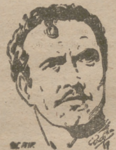
LA ZARZUELA Y SU RENOVACION

Vivian Leigh y Marlon Brande son los favoritos para la concesión de los "Oscar" que se celebrará mañana, jueves, por la noche, en la XXI reunión anual de la Academia de Ciencias Cinematográficas. Vivian Leigh y Marlon Brande interpretan los papeles principales de la película "Un