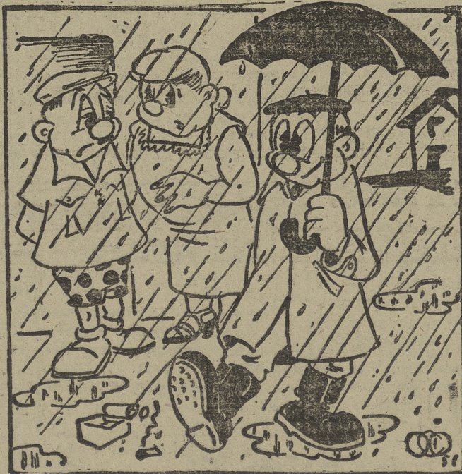
—¿Ves? ¡Esté ya na estado otros años aquí!...