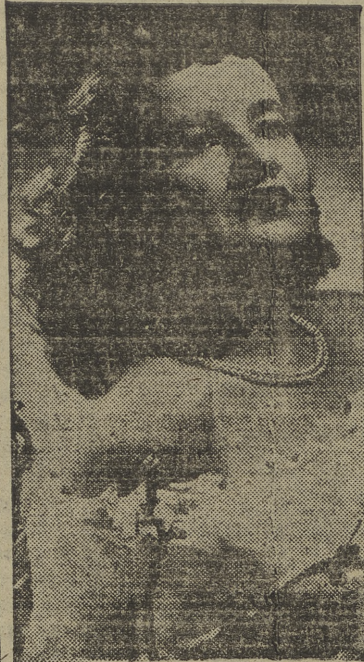
la esperanza es lo último que se pierde, pero la vida da tan duros golpes, que no sé...

—¿Esperas mucho de la vida? —¡He pasado tanto ya! De esto me ha quedado un carácter extraño. A veces tengo ganas de llorar, y lo hago si me quedo sola en una habitación. Esperamos mucho, porque