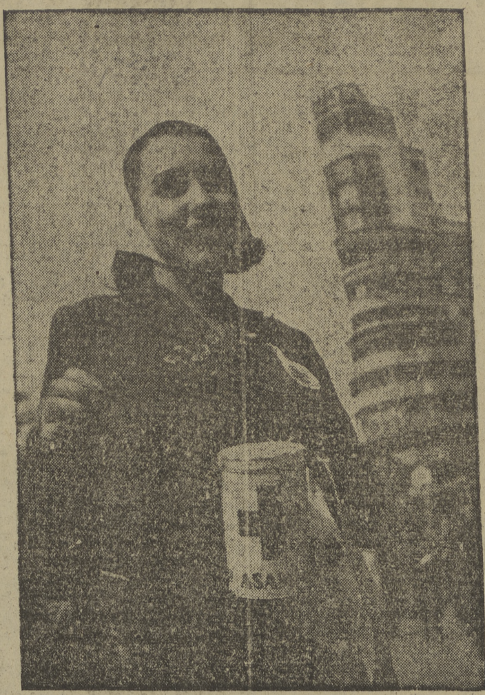
La Fiesta de la Bandera a beneficio de la Cruz Roja Española se ha celebrado, en Madrid. He aquí a una bella muchachita postulante, ante el edificio del Capitol, en la Gran Vía, que por su simpatía y dinamismo acaparó la atención de los transeúntes.