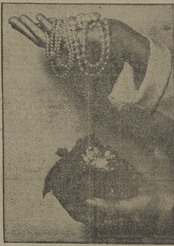
Una industria nueva y floreciente ha surgido en Francia. Se trata de la fabricación de perlas artificiales con residuos de moluscos marinos. Las perlas así fabricadas tienen el mismo tono y apariencia que las verdaderas. En la fotografía se compara un monito de los citados residuos con un collar de perlas obtenidas después de su conversión

Cierto es que en estos momentos, en que tanto se habla de la vida cara, este apoteosis del ahorro puede parecerles a algunos un tanto paradójico. Pero es innegable que, por contraste, se resalta aún más las excelencias de esa virtud social que reside casi siempre en los éticamente más sanos del pueblo trabajador —Argos.