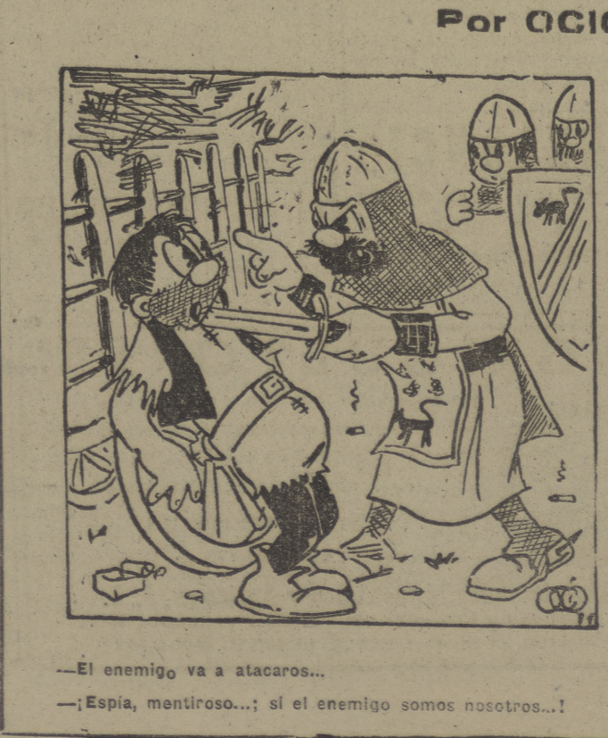
—El enemigo va a atacarnos... —¡Espía, mentiroso...! si el enemigo somos nosotros...!