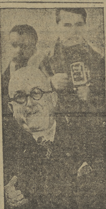
El presidente Auriol, que la «foto» de Internacional News Service presenta a su llegada a Norteamérica, ha arribado a la ciudad de Nueva York enfermo de gripes. Ayer asistió a una recepción en el Ayuntamiento de la ciudad de los rascacielos, en la que impuso el distintivo de la Legión de Honor al alcalde, Impellitteri. Según cálculos de la Policía, 75.000 personas aclamaron al presidente de la República francesa a su paso por Broadway.

63 divisiones chinas se preparan para el ataque FRENTE DE COREA. — Fuerzas norteamericanas han establecido posiciones a 16 kilómetros al Norte del paralelo 38. Los tropas aliadas están a tiro de cañón del triángulo Hwangchon - Yongchon - Chorwon, donde se encuentran o o n centrados el grueso de las tropas chinas y hacia donde se dirigen la mayoría de los abastecimientos rojos. Las patrullas blindadas de las Naciones Unidas presionan en el frente occidental, frente a escasa o esporádica resistencia enemiga.