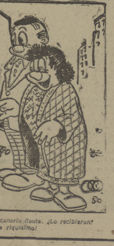
EL. — Les mandé un buen canario flauta. ¿Lo recibieron? ELLA. — ¡Oh, sí...! ¡Estaba riquísimo!