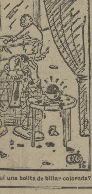
—¿Ha visto usted por aquí una bolita de billar colorada?