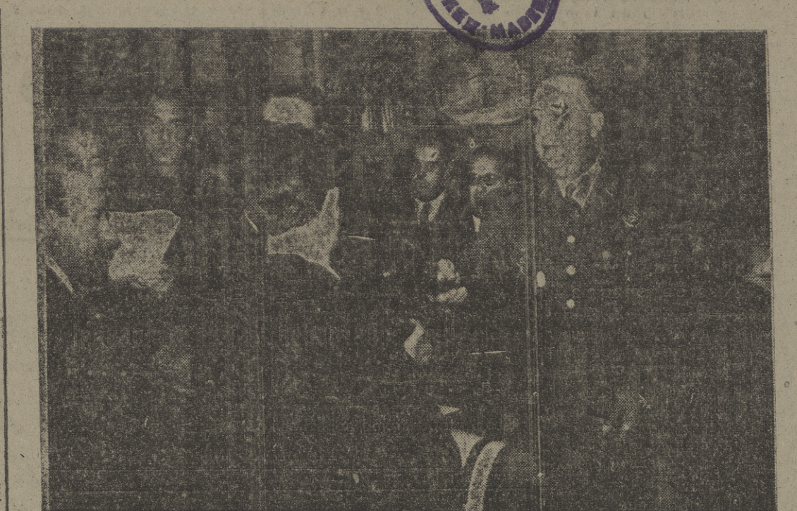
Su Excelencia el Jefe del Estado en el acto de entregar a los aprendices ganadores del concurso de formación profesional obrera sus títulos de "Mejor Aprendiz de España" de su especialidad.

SEVILLA, 9. — Mr. Starni ha llegado para presidir los 12.º congresos de los 12.º departamentos hermanados y de la literatura.