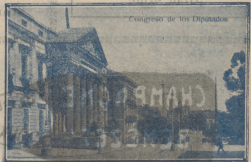
Congreso de los Diputados.—Madrid

El mejor vino de Valdepeñas lo encontrará aquí 7, MANUEL FERNÁNDEZ Y GONZÁLEZ, 7 (ANTES VISITACION)