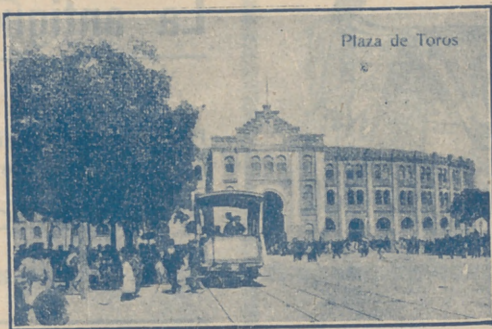
Plaza de Toros.—Madrid

Dirección, Plaza de la Villa, 4, teléfono 10922.—Inspección, Casa Cisneros, Plaza de la Villa, 4, telé- fono 11227.—Inspección de Alcantarillas, Plaza de la Constitución, 3, teléf. 10012.—Almacenes de la Villa, Santa Engracia, 104, teléf. 30034.—Alumbrado, Di- rección, Plaza de la Villa, 5, teléf. 10624.—Arquitectos, Dirección, Plaza de la Villa, 4, teléf. 11406.—Carruajes, Dirección, Plaza de la Constitución, telé- fono 11070.—Colegio de Ntra. Sra. de la Paloma, Dehesa de la Villa, teléf. 30410.—Depositaria Municipal, Plaza de la Villa, 5, teléf. 12853.—Ensanche, Jefe Negociado, Ayala, 14, teléf. 52859.—Inspección facultativa, Costanilla de los Angeles, 13, teléfo- no 13659.—Guarcia Municipal, Jefatura, Plaza de la Constitución, 3, teléf. 20021.—Guardia de Caballería, Costanilla de los Desamparados, 15, tel. 10651.—Im- prenta municipal, Sacramento, 2, tel. 13337.—Incen- dios, Dirección, Imperial, 10, tel. 12800.—Laborato- rio central, Bailén, 43, tel. 70320.—Puesto de Desin- fección, Plaza de San Francisco, 3, tel. 73729.—Lim- piezas, Dirección, Imperial, 10, tel. 14630.—Matade- ros, Dirección, Paseo de la Chopera, tel. 70116.—Mercado de la Cebada, Plaza de la Cebada, teléfo- no 70405.—Mercado de los Mostenses, Plaza de los Mostenses, teléf. 15279.—Parques y jardines, Direc- ción, Parque de Madrid, teléf. 54382.—Puericultura, Casa central, Peñón, 23, teléfono 71341.