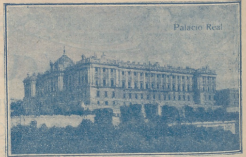
Palacio Real, de Madrid