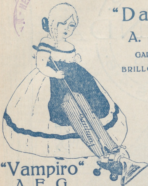
"Vampiro" A. E. G.