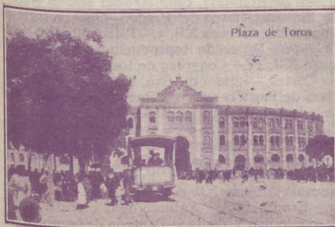
Plaza de Toros

Pabada y pote asturiano TRES CRUCES, 1. MADRID