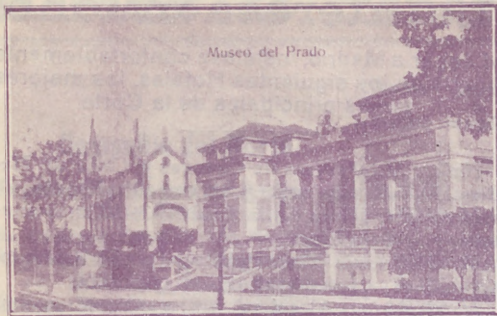
Museo del Prado