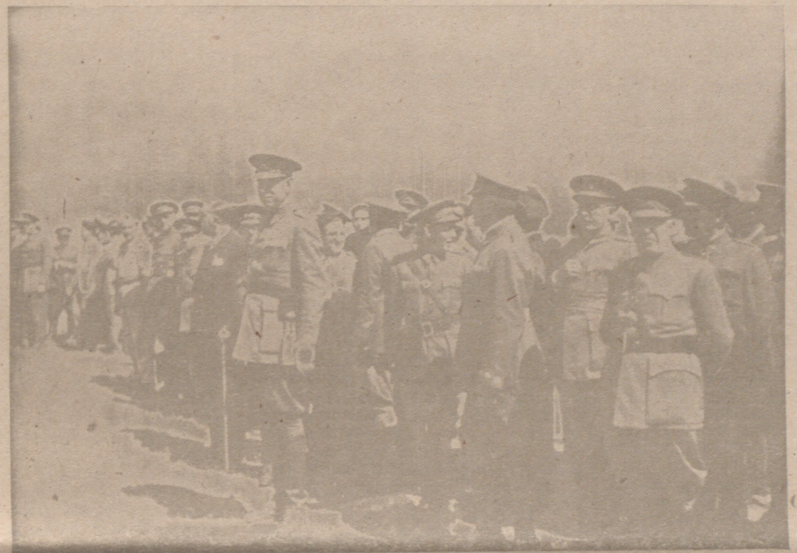
El general Mola revistando las tropas al llegar en avión a Burgos por vez primera el 21 de julio de 1936