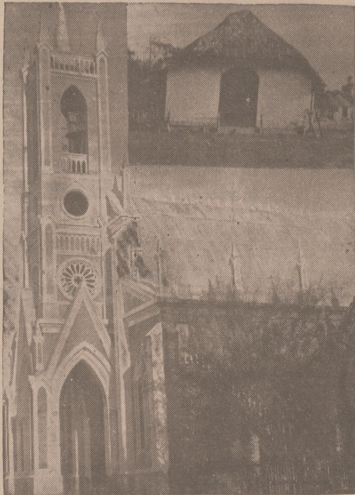
En la parte superior de la fotografía, la primera iglesia levantada por los misioneros del Seminario de Burgos. Con su esfuerzo y trabajo manual lograron levantar esta sencilla y elegante iglesia que aparece en la parte inferior y que es la mejor de la Misión.

Y es de esperar que el resurgimiento de la nueva España por la que luchan voluntarios desde el día primera de la contienda 17 alumnos, de los treinta que tiene el Seminario, y que eran los únicos y todos los que por su edad estaban dispuestos a empuñar las armas, recobra la Patria el impulso misionero que la glorificó más que todos los triunfos a lo largo de su Historia incomparable.