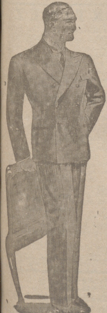
Trajes de pana o paño para Sport de 80 a 125 pesetas.

Casa Munguía. Plaza Mayor, 48 y Lain Calvo, 9. Sucursal: Plaza Mayor 5. BURGOS