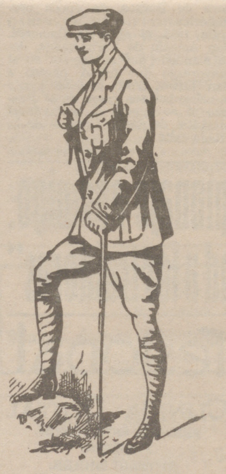
Trajes de pana o paño para Sport de 80 a 125 pesetas CONFECCION BUENA