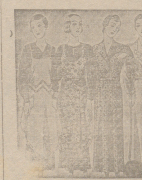
Vestidos, batas, kimonos de bañistas, percales o trovales, de 7, 8, 9, 10, 12 y 14 pies

Plaza Mayor, 48 y Lain Calvo, 9 Sucursal: Plaza Mayor 5 BURGOS Primera casa en conexiones para caballero, señora, jóvenes y niños Telidos, Pañería y Sastoría