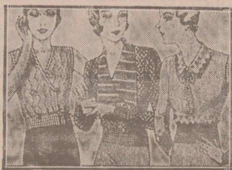
Blusas punto novedad, a 5, 6, 8, 10 y 12 ptas

Primera casa en confecciones para caballero, señora, jóvenes y niños Tejidos, Pañería y Sastrería