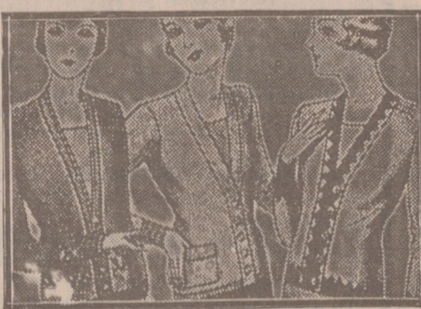
Blusas chaquetillas, de 7, 8, 10, 12 y 15 ptas.