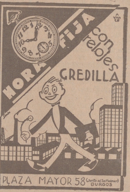
PLAZA MAYOR 58

SE HABLE MUCHO DE ACCION SOCIAL CATOLICA PER, SON CONTADOS LOS QUE SABEN QUE EL PRIMER DEBER DE TODOS ES PROPAGAR Y PROTEGER EL DIARIO CATOLICO (Obispo de Tarbes)