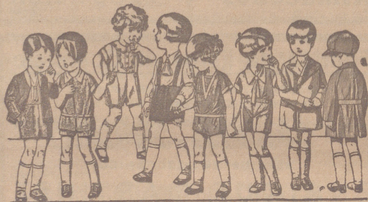
Diversidad de modelos en trajecitos para niños en punto, dril, lana o pana, de 5 a 15 ptas.

Primera casa en confecciones para caballero, señora, jóvenes y niños Tejidos, Pañería y Sastoría