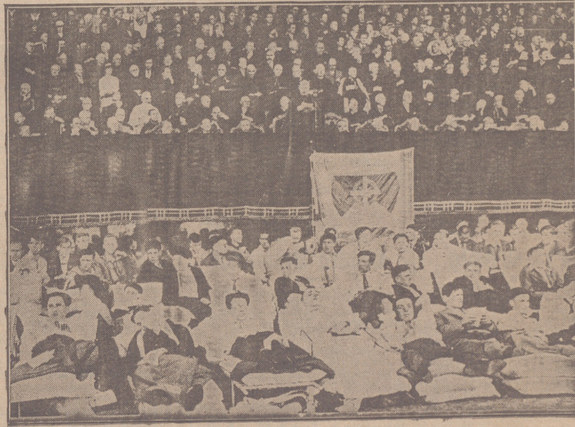
En la inmensa tribuna presidencial, el cardenal Van Roey da lectura a la carta-bendición del Papa. Bajo la tribuna, los jocistas enfermos en sus camillas