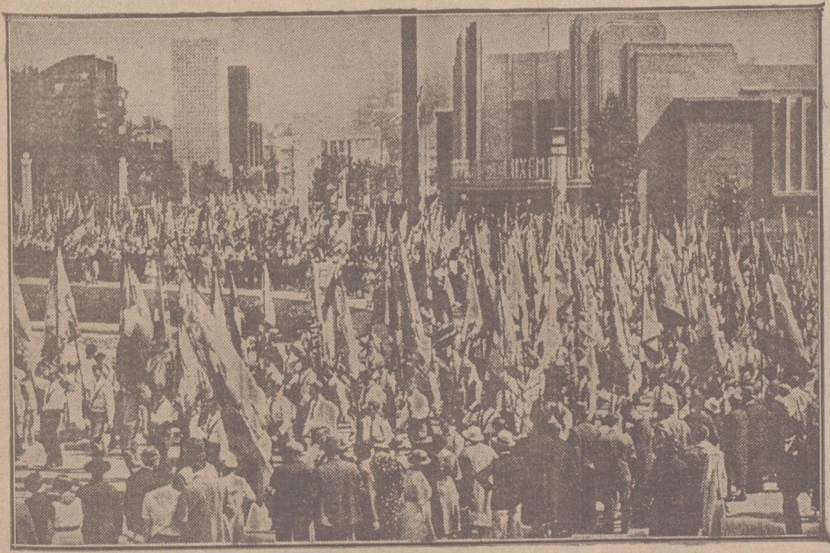
La imponente manifestación jocista atraviesa las calles de Bruselas camino del estadio

El magnífico Congreso mundial ha demostrado plenamente el triunfo del ideal de los métodos y de la organización jocista.