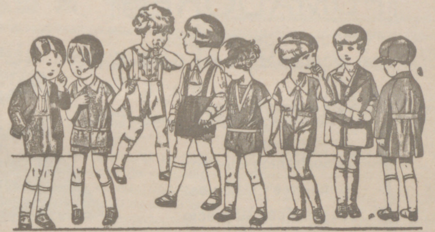
Diversidad de modelos en trajesitos para niños en punto, dril, lana o pana, de 5 a 15 plás.

Primera casa en confecciones para caballero, señora, jóvenes y niños Tejidos, Pañería y Sastrería