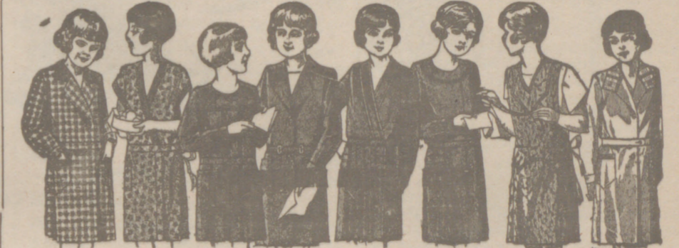
20 modelos distintos en vestiditos para niñas. En percal, de 6 a 10 años, de 4 a 6 plás. En Trovacoles, de 6 a 10 años, de 5 a 7 plás. En crespones seda, de 6 a 10 años, de 10 a 20 plás.