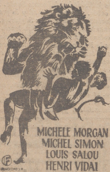
MICHELE MORGAN MICHEL SIMON LOUIS SALOU HENRI VIDAI

SE RUEGA LA PUNTUALIDAD por el EXCEPCIONAL METRAJE DEL FILM HORARIO: Tarde 3,30 V. mut, 6,45 Noche 10,15 PELICULA, BASE: Tarde, 3,45 V. mut, 7 Noche, 10,30