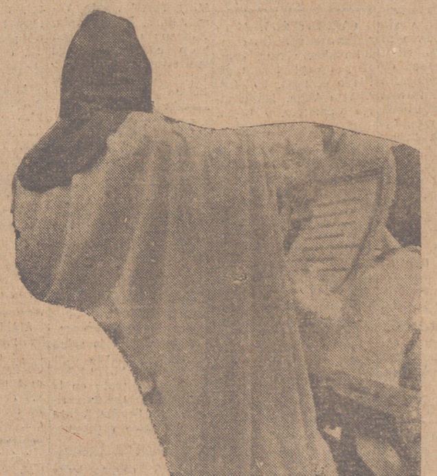
Anunciando por toda la ciudad el sermón de las Siete Palabras en la Plaza Mayor, que este año fué predicado por el reverendo Padre Esteban, misionero de la Compañía de Jesús

1949 irre- precios bles... CONTACTO CO PIANTE LIN ACIONAL idad DIARIO ORGANIZACI BIENCIA N NO L.1657 RES delos de NOMICO ON RAPIDAS el Val. EROS MO s para bateros ADOLID SCO S ON, 8 774 uede simas epago DI AS RCAS a. SA 2798 S culo us derse, u sta por vigente, señalad GRATIS aia pri ción e Eaval. Te y Alcorc modelos competen una m ción. Fran ntro. Me apo. cuento e ia contie necesite S EAVAL 2 y Alar asa Medi tres plan a. Ciudad tterra de y medio pequeño a Martín S Alcorc MAIZ. M pescado a, sacor Z. Mant moder at, robie a y hay aticas y Grand aterial tr s carter mader EN LA ABLEROS ENTRE UMENTO lo, 1.024