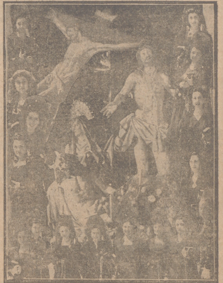
He aquí la nota gráfica de la festividad del Jueves Santo. El sol radiante proporcionó, si cabía, más solemnidad y la mantilla española se prodigó durante la visita a los Sagrarios. Por la tarde salió la emocionante procesion de Penitencia y Caridad. El patetismo de estas tres imágenes—La Piedad, Cristo del Perdón y Cristo de la Preciosa Sangre—fue cobrando intensidad a medida que la tarde iba cayendo, hasta culminar en los dramáticos momentos de la visita a la Cárcel y al Pabellón Antituberculoso, después de haberse parado frente al Hospital. Enfermos y presos entonaron cánticos en solidaridad de la misericordia divina y un inmenso gentío, apinado a lo largo del itinerario, se asoció con las palpitaciones de su corazón y el rezo en sus labios a la emoción general de este desfile procesional del Jueves Santo.

hicieron también la visita de las iglesias y el Ayuntamiento lo verificó bajo mazas. De la misma manera las fuerzas del Ejército y Frente de Juventudes, en correcta formación, hicieron la visita tradicional. (Pasa a la página 3.ª)