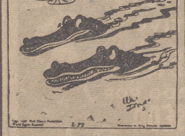
Algunas veces me preocupa el peligro de quedarme saturado de humedad y pudrirme como un viejo tronco caído al agua.

formaciones de la Iglesia Catedral, la muchedumbre se agolpó tras el cortejo en una impresionante oleada de fe cristiana.