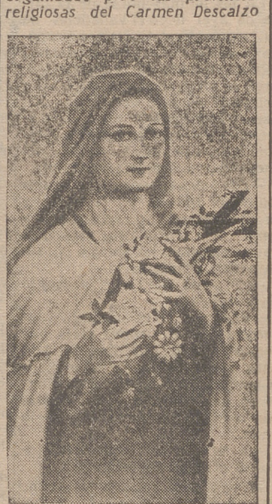
Es un homenaje católico de España a la Santita, muy en armonía con sus deseos universales. «Me anima—dice—la vocación de cruzado, de sacerdote, de apóstol, de doctor, de mártir.»

PROPUESTO POR S. S. EL PAPA PIO XII, PRESIDIDO POR NUESTRAS AUTORIDADES ECLESIASTICAS Y CIVILES Organizado por las provincias religiosas del Carmen Descalzo