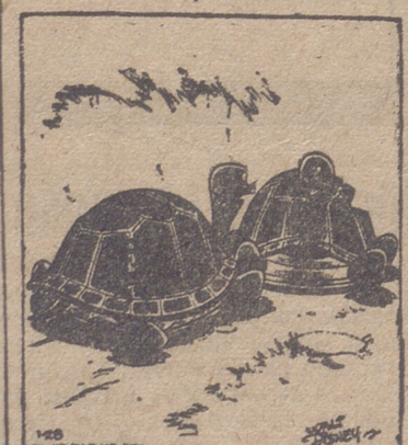
Tortuga primera (leyendo): '¡Joe quiere a Sue, 1929.' Tortuga segunda: 'Sí, pero al año siguiente se fué a Reno para pedir el divorcio.'

Lengua celebrará su primer ciclo de sesiones del 2 al 9 de octubre, quedando después abierto un período de estudios y trabajo en el que serán redactadas las diversas ponencias para después, en el mes de abril, celebrar nuevas reuniones y terminar en una sesión solemne el día 23, fiesta del Libro y aniversario de la muerte del manco de Lepanto. Las reuniones de la Asamblea tendrán por escenario, además de la Academia, el Paraninfo de la Ciudad Universitaria, los salones del Consejo Superior de Investigaciones Científicas de la calle de Medinaceli y el espléndido Paraninfo del edificio central del Consejo, recientemente inaugurado en los altos del Hipódromo. El día 3 de octubre, con asistencia de las altas autoridades del Estado, se celebrará un acto en Alcalá de Henares, que a la vez que inauguración de las conmemoraciones cervantinas sirva de apertura al curso académico.