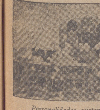
Personalidades asistentes a los actos celebrados ayer.

Sevilla, 24.—Han salido para Santiago, donde tomarán el avión que les conducirá a Madrid, los ministros del Aire, general González Gallarza, y de Trabajo, camarada Girón, así como el subsecretario del Aire, general Sáenz de Buruaga.—Cifra.