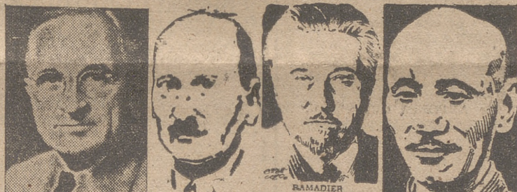
De izquierda a derecha: TRUMAN, ATTLEE, RAMADIER y CHANG-KAI-CHEK

EL QUINTO GRANDE, STALIN, NO QUISO SUMARSE A SUS COLEGAS, LO QUE MARCA LA ESCISION DEL MUNDO EN DOS GIGANTESCOS BLOQUES