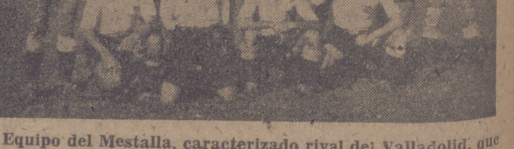
Equipo del Mestalla, caracterizado rival del Valladolid, que el domingo perdió por 3-0.