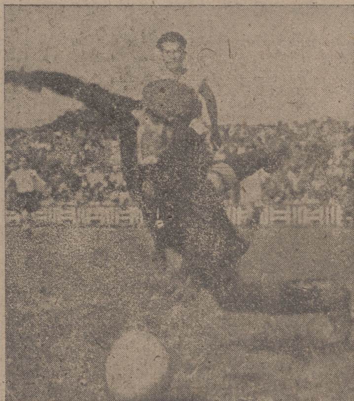
Una de las múltiples ocasiones de marcar, que terminaron fuera del marco.

Fue el encuentro que vimos el domingo frente al Mestalla si no el de más juego de la temporada, ya que contra el Osasuna se ligó más fuego y se hizo más fútbol, si el de más emoción, el más interesante y el más agradable para los aficionados, pues dos grandes equipos frente a frente, disputando se quizá el ascenso automático, se batieron con esa furia española que un día nos hizo célebres en el mundo y que hoy parece recluida en los campos modestos y aireada en las grandes solemnidades. Nosotros, que somos encendidos admiradores de este fútbol rabioso, contenida de hombres con corazón y con ilusiones, la gozamos el domingo, aunque a buen seguro que el corazón y los nervios hayan recibido un gran disgusto. Vimos un partido de campeonato de las épocas áureas del fútbol de España. Dominó más el Valladolid, pero sin conseguir en ningún momento acorralar a los valencianos. Atacaron y presionaron más los castellanos sobre la puerta adversaria, pero el Mestalla acusó en los dos tiempos la profundidad de su línea delantera, la facilidad de tiro de sus hombres y la gran conjunción de sus componentes, que estrechamente marcados por los locales se revolotaban en terreno inverosímil, buscaban el desmarque y acosaban sin tregua a las sólidas posiciones del