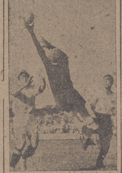
(Información del encuentro en última página.)