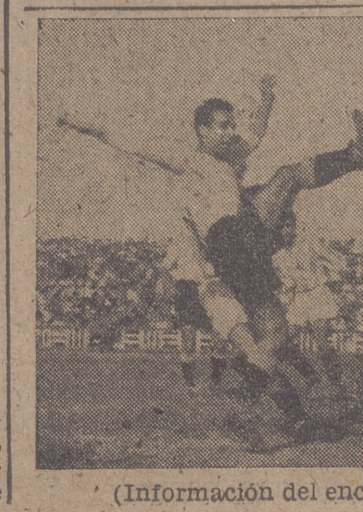
(Información del encuentro en última página.)

Saint Louis, 16.—Veinte mil personas han quedado sin hogar y grandes extensiones de tierras cultivadas se han ahogado en las inundaciones causadas por las crecidas del Missouri, por las crecidas del Missouri, y se teme otra segunda inundación en la cuenca del Mississippi dentro de un par de días. Se calcula en cuarenta millones los daños materiales causados en Iowa, Illinois y Missouri.—Efe.