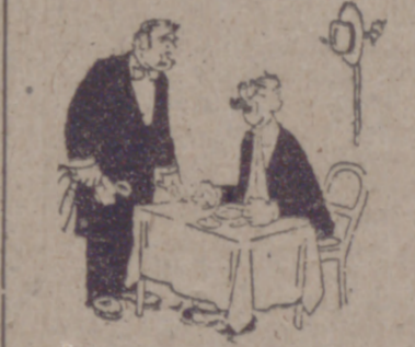
El cliente.—Hay una maza en la manteca. El mozo.—¡Perdón! No es mosca, sino mosquito. Ni es manteca, sino margarina. Por lo demás, lleva usted razón.