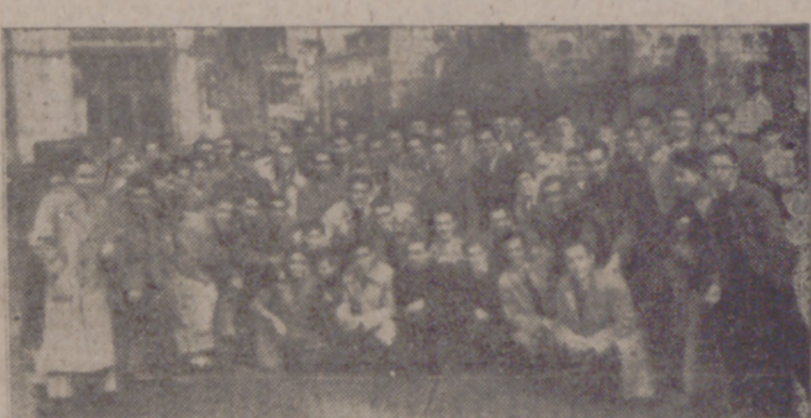
Octavo grupo de hinchas del Valladolid antes del partido.

magníficamente, desvió el centro del extremo, marcando el tanto. El tanto del Valladolid lo marcó Titi al rematar un centro de Ballesteros a poco de comenzar el segundo tiempo.