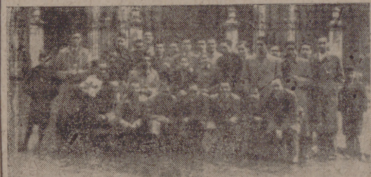
Grupo de aficionados vallisoletanos que antes del partido se dedicaron a visitar los monumentos artísticos, ante la Catedral leonesa.

Busquet fué expulsado poco antes de terminar el partido