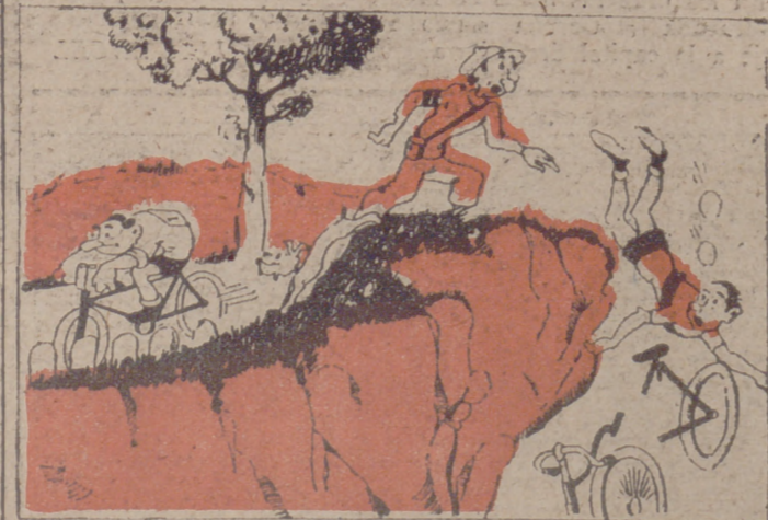
DESPISTADO —¿Eh, eh; eso no vale; queda descalificado por acortar el camino! (Por ITO)

—¿Eh, eh; eso no vale; queda descalificado por acortar el camino! (Por ITO)