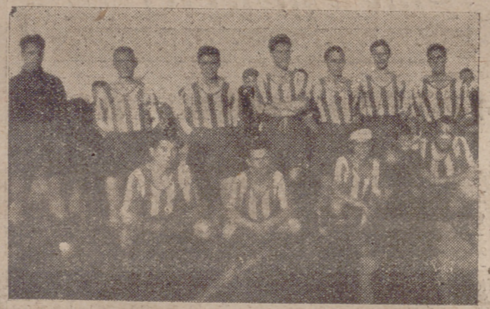
Equipo actual del D. Zorrilla.