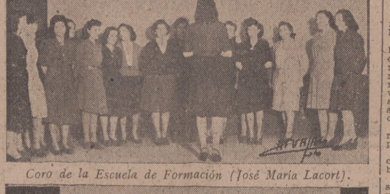
Coro de la Escuela de Formación (José María Lacort).