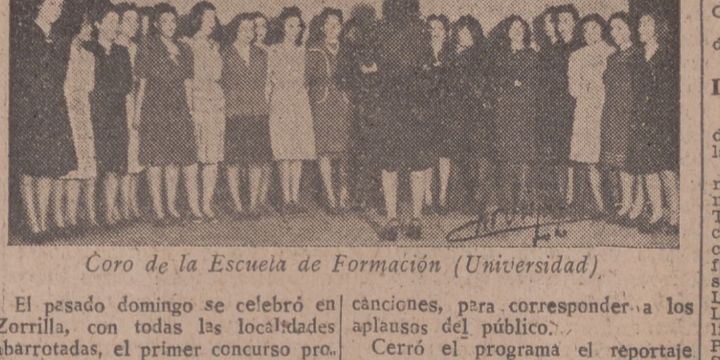
Coro de la Escuela de Formación (Universidad).