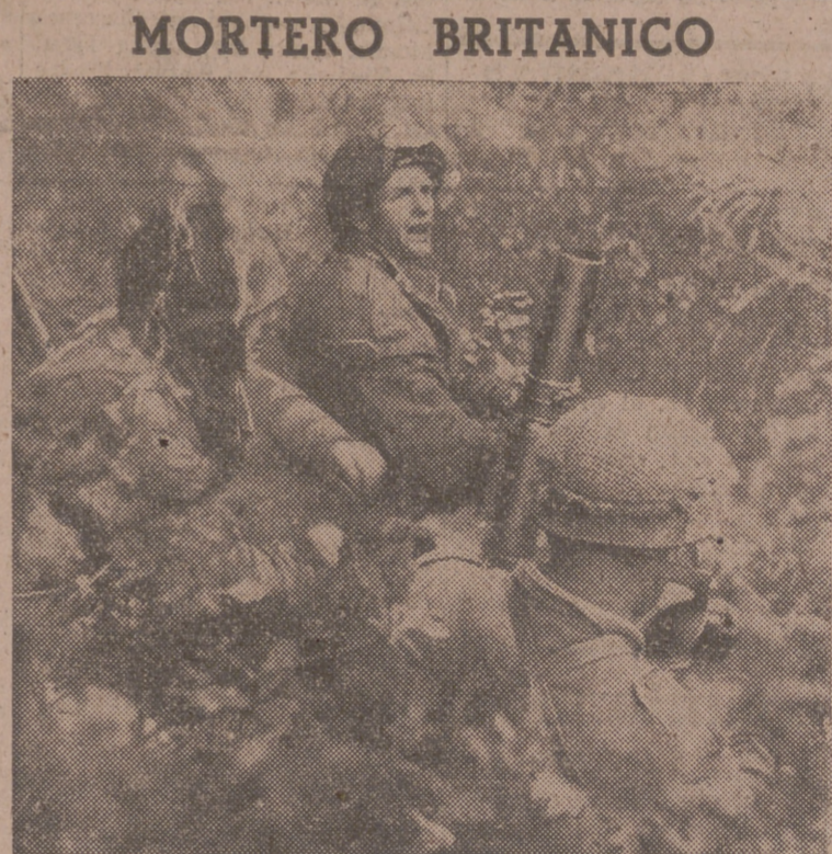
Un mortero británico entra en acción en el frente holandés

Esta fórmula de la guerra moderna, por cierto, ha sido (Pasa a la última página.)