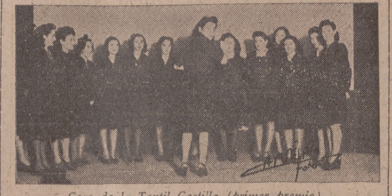
Coro de la Textil Castilla (primer premio).

Obtuvo el primer puesto el de "Textil Castilla" y el segundo el de la Fábrica Nacional