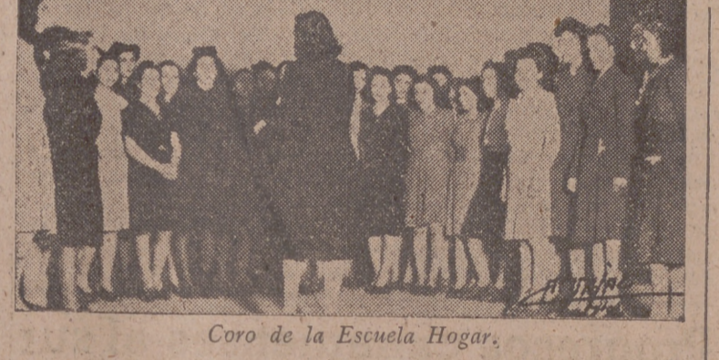
Coro de la Escuela Hogar.