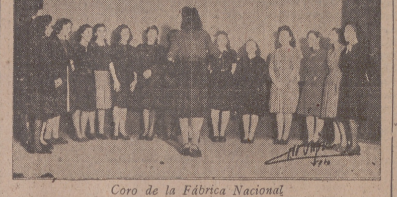
Coro de la Fábrica Nacional