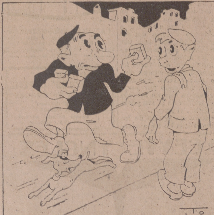
POR SI ACASO.—Por ITO. —¿Pero por qué corre? —Porque se deben haber equivocado. ¡Me han dado tres cuarterones de tabaco!

Todo buen español tiene que congratularse de que en los últimos tiempos el trabajo haya ocupado el lugar preeminente que exige nuestra tarea de reconstrucción. Y la importancia de los resultados obtenidos demuestra que debemos estar pendientes de una sola noticia: la de la construcción de España y de su engrandecimiento. Como nombres nada nos es ajeno, y nos interesan las noticias; como españoles nos interesa nuestro común esfuerzo en bien de la Patria. Y que nadie se confunda. Adelante. (De «El Español».)